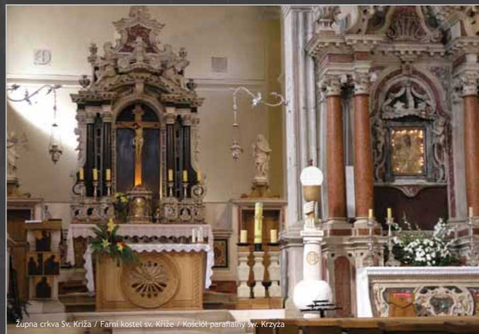
Župna crkva Sv. Križa / Farní kostel sv. Križe / Kościół parafialny św. Krzyża