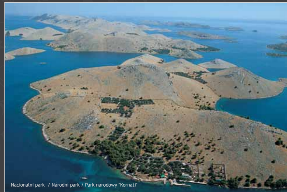
Nacionalni park / Národní park / Park narodowy "Kornati"