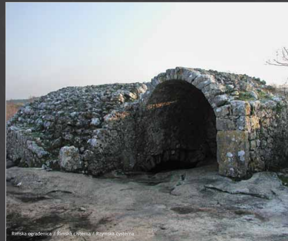
Rimska ogradenica / Římská cisterna / Rzymska cysterna

Danu mirno turističko središte nudi mogućnost posjeta izložbama, galerijama, arheološkim nalazištima, a noću se pretvara u veliku, glasnu i šarenu pozornicu.