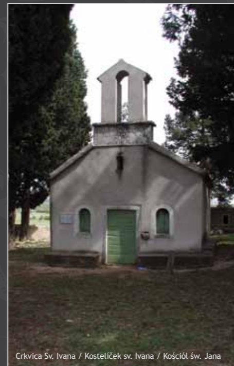
Crkvica Sv. Ivana / Kosteliček sv. Ivana / Kościół św. Jana