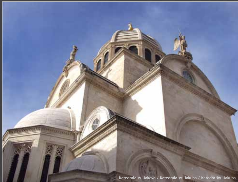
Katedrál sv. Jakova / Katedrála sv. Jakuba / Katedra św. Jakuba

S kradin i Šibenik, prijestolnice starohrvatskih kraljeva, stameni svjedoci slavne prošlosti, danas zrače svojom osobnošću.