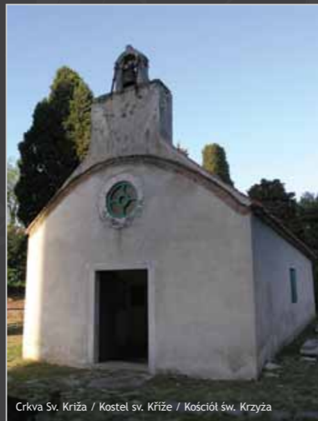
Crkva Sv. Križa / Kostel sv. Križe / Kościół św. Krzyża