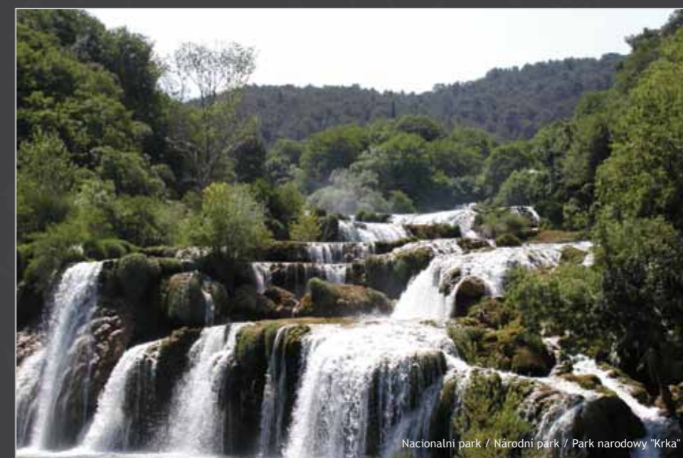
Nacionalni park / Národní park / Park narodowy "Krka"

“Posljednjeg dana stvaranja svijeta Bog je želio okruniti svoje djelo i tako je stvorio Kornate prosvuši suze, zvijezde i uzdahe.”